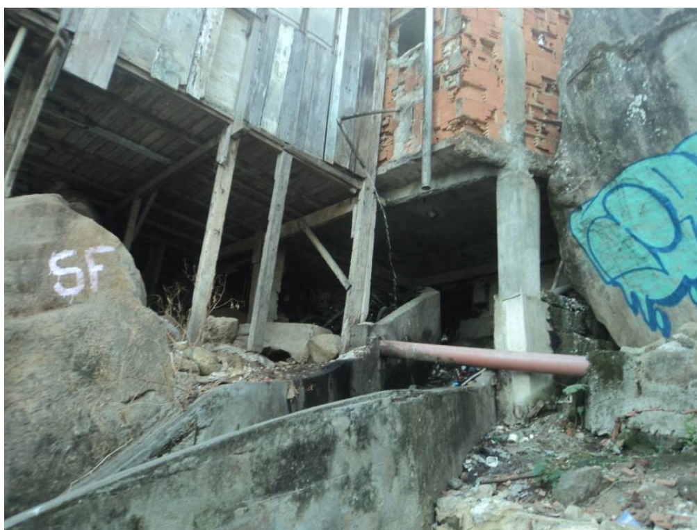
Figura 1 –Fotografia tirada pelas crianças que participaram da oficina no morro Santa Marta

Outro assunto frequente nas oficinas foi o uso do bondinho, o plano inclinado, inaugurado em 2008, que dá acesso à parte alta do morro. Meninas e meninos ressaltaram o seu uso como um passeio, pois era divertido ver a rua e a favela do alto. Durante o passeio fotográfico, um menino ficou animado quando soube que pegaríamos o bondinho: “eu só andei de bonde duas vezes, que legal!” Para uma menina, a parte “mais legal do passeio foi ter andado de bondinho”. Algumas crianças nos contaram que usavam o plano inclinado diariamente para ir à escola, demonstrando grande familiaridade e considerando-o como um meio de transporte. Para elas, a criação do bondinho foi algo bom para a favela, uma vez que facilitava o deslocamento e o acesso à parte alta do morro: “o bondinho é muito