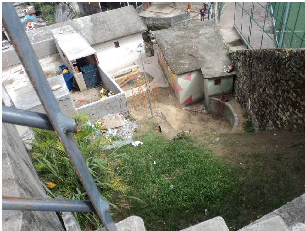
Figura 2 – Fotografia tirada pelas crianças que participaram da oficina no morro Santa Marta

Na fotografia anterior, as crianças registraram a escada que dá acesso à Praça do Pico com uma parte do seu gradeado quebrada. Adultos que conhecem o local se surpreenderam com a