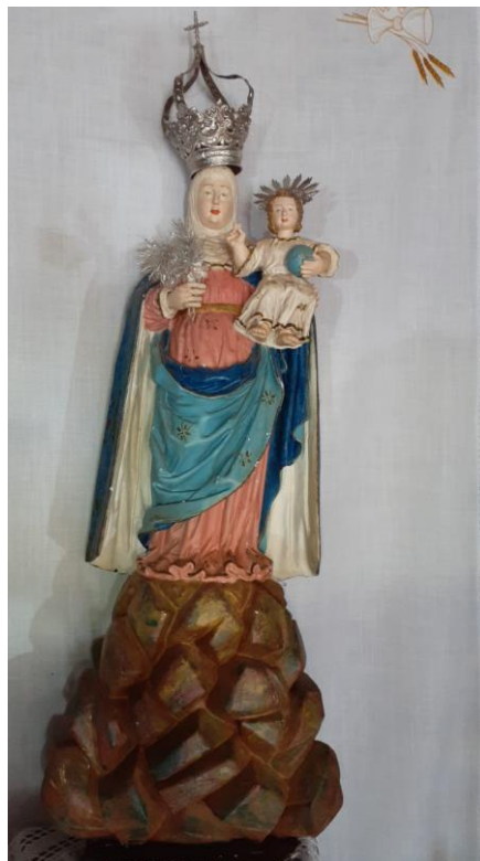
[Fig. 3] Anônimo. Nossa Senhora da Penha de França . Séc. XVIII. Portugal. Madeira policromada. 110 x 40cm. Capela de Nossa Senhora da Penha de França, Distrito de Penedia, Caeté – MG.

A imagem de Nossa Senhora da Penha de Penedia apresenta o entalhe de um segundo manto azul-marinho com forro branco descendo-lhe a partir dos ombros e recobrendo toda a parte posterior da escultura, como que uma capa, fazendo as vezes daquele manto de tecido que encontramos na imagem paulistana. Também constatamos, nessa imagem mineira, uma espécie de véu (semelhante a uma ‘pala’, parte do hábito das religiosas), recobrendo a cabeça e o pescoço, emoldurando o rosto e deixando cabelo e orelhas velados. Esse véu também pode ser observado na imagem de Nossa Senhora da Penha do Rio de Janeiro – RJ, igualmente de procedência