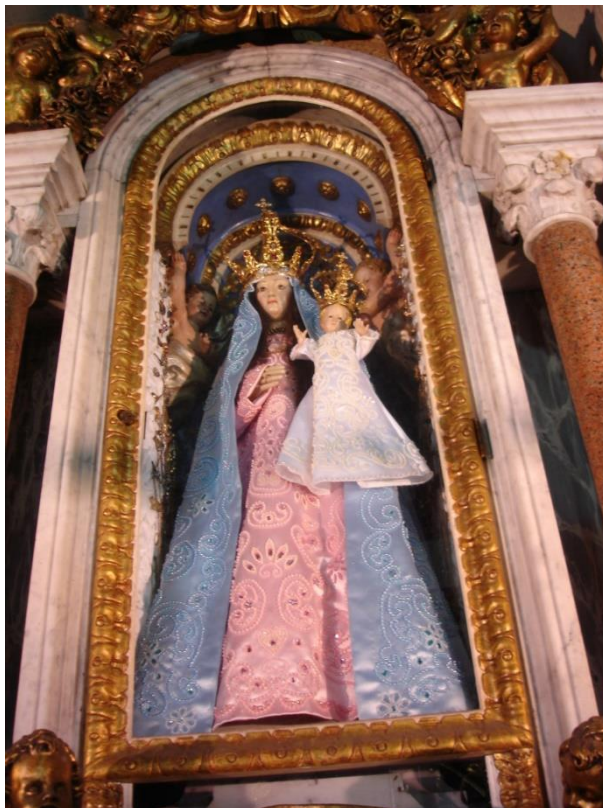
[Fig. 7] Anônimo. Nossa Senhora da Penha . Séc. XVI. Portugal. Madeira policromada. Convento da Penha, Vila Velha – ES.