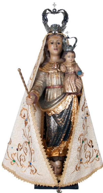
[Fig. 2] Anônimo. Nossa Senhora da Penha de França . Séc. XVII. Madeira policromada e dourada. 75 x 30cm. Basílica de Nossa Senhora da Penha, São Paulo – SP.

dourada. Vestido e manto possuem algumas flores estilizadas como elemento decorativo. Essas semelhanças entre as imagens do povoado de Penedia e da cidade de São Paulo contribuem para supormos com mais segurança a procedência portuguesa do exemplar paulistano, já que a de Caeté é oriunda de Portugal, conforme o relato da história do capitão Luis de Figueirêdo Monterroio. Existem, porém, alguns diferenciais das vestes da Virgem de Caeté em relação à da capital paulista, a saber: