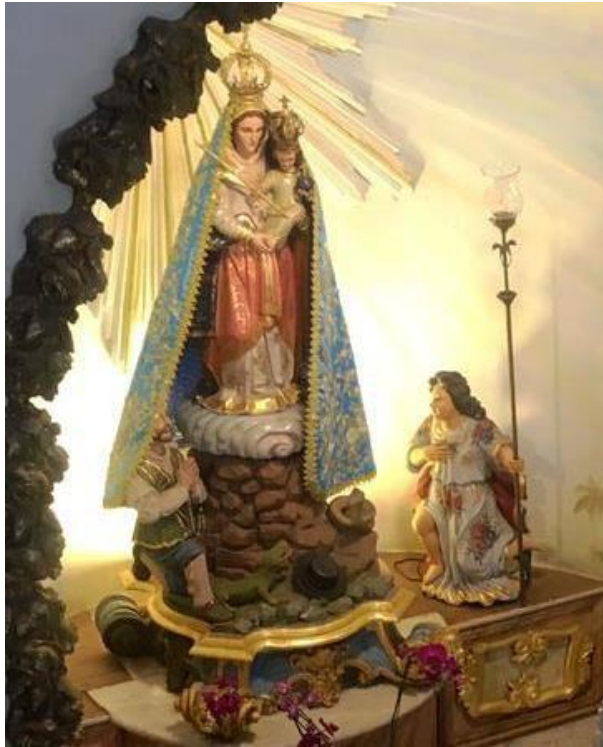
[Fig. 6] Anônimo. Nossa Senhora da Penha de França . Séc. XVII. Portugal. Madeira policromada. 84cm (sem base com o monte e as figuras do homem e dos animais). Santuário-Basilica de Nossa Senhora da Penha de França, Rio de Janeiro - RJ.

consequentemente, na sua produção artística. Não raras vezes, por conta dessas cores tão características, bem como pela presença do Menino aos braços e dos atributos da coroa e do cetro, a Virgem da Penha acaba sendo confundida com Nossa Senhora Auxiliadora, cujas representações populares são mais contemporâneas.