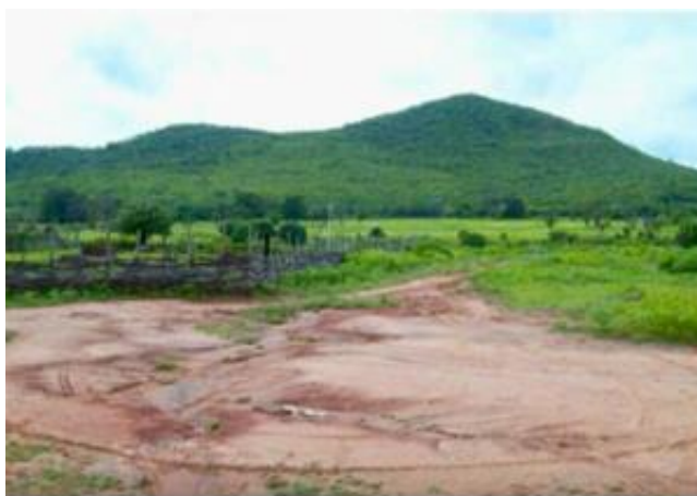
Figura 03 - Serra do Besouro no inverno de 2008.