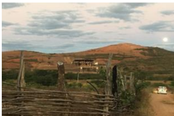
Figura 04 - Serra do Besouro no verão de 2018.

As comunidades entenderam concretamente os efeitos da mineração (veja na figura 2 as áreas mais afetadas por poeira, rejeitos e explosivos) quando começaram a sofrer os impactos socioambientais desde o assoreamento do Rio Poty até os prejuízos da economia camponesa com a diminuição da produção de grãos, frutas, verduras, criação de animais, e, o mais grave, o adoecimento mais frequente das pessoas. Segundo os moradores, as doenças mais frequentes depois que a empresa Globest iniciou a extração de minério de ferro foram asma, tireoide, virose, coceira, alergias, entre outras. A poeira é uma das principais causas de problemas em relação a saúde (afetou todas as áreas da figura 2), e sobre isso a camponesa Luiza Sobral disse 22 :