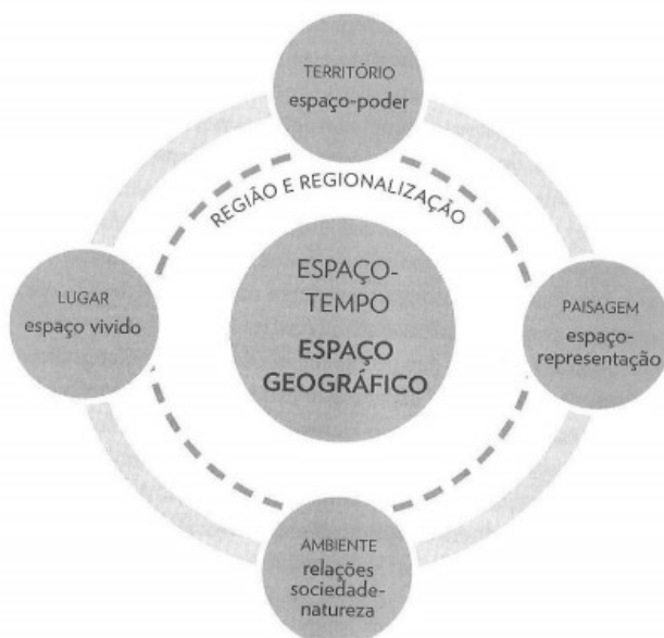
Figura 1 - Constelação de Conceitos Geográficos.

Dentre os conceitos da Geografia, o espaço geográfico é o mais abrangente, pois reúne as dimensões da percepção humana como “um todo”. Haesbaert (2014) na sua denominação de constelações de conceitos geográficos (Figura 1), descreve que entre os conceitos geográficos o de espaço é o mais amplo, do qual derivam e se relacionam os outros conceitos da Geografia. Assim, pode-se dizer que o espaço geográfico é o fruto da ação humana sobre a natureza, modificando-a e transformando-a, portanto, abrangendo o mundo todo.