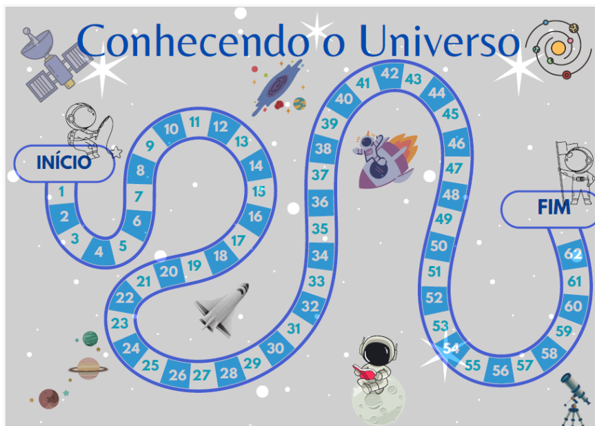
Figura 1 – Tabuleiro do jogo Conhecendo o Universo.

Na Figura 1 é exibido o tabuleiro do jogo, impresso em papel fotográfico, em formato A3. Percebe-se que ele tem um formato tradicional, semelhante aos demais jogos de tabuleiro clássicos.