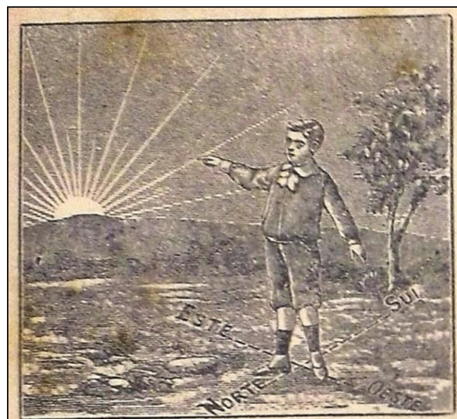
Figura 2 – “Maneiras de orientar-se”. (FTD, 1923, p. 2)