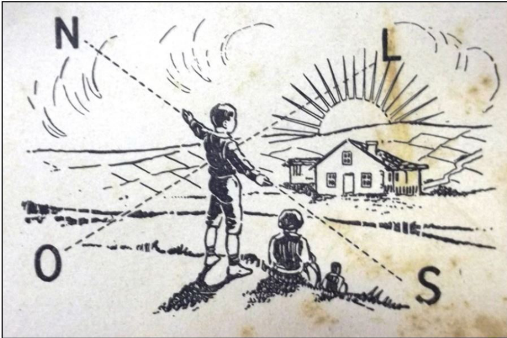
Figura 1 – Pontos cardeais e o clássico sentido de orientação pelo Sol. (LOBATO, 1935, p. 17)

As figuras seguintes, 1, 2 e 3, trazem a ilustração contida na Geografia de Dona Benta e as figuras contidas em livros didáticos contemporâneos a ela, e nos asseguram as conclusões que viemos apontando: