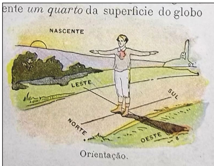
Figura 3 – “Orientação”. (THIRÉ, 1913, p. 1)

À diferença das ilustrações expressas nos livros didáticos, a ilustração presente na literatura da Geografia de Dona Benta destoa quanto ao posicionamento em relação ao Sol. Nas ilustrações dos livros didáticos mantém-se o norte sempre à frente da cabeça do observador, ao passo que na ilustração da obra de Lobato o leste, “lugar onde está a luz”, mantém-se à frente de quem observa um indício, uma reticência do pensamento do autor. Seriam as imagens contidas na Geografia de Dona Benta apenas representações situacionais, sem o compromisso com o respeito aos conteúdos veiculados oficialmente nos livros de teor didático?